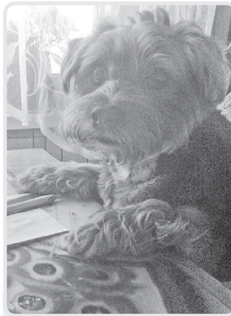
«Письмо Деду Морозу».